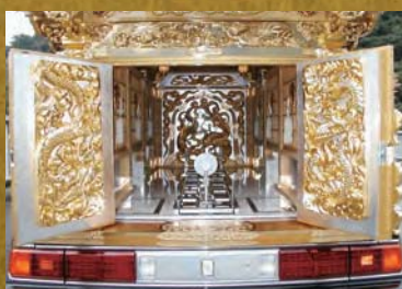
関東型宮型霊柩自動車の納棺室